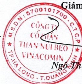
Ngô Thế Phiệt